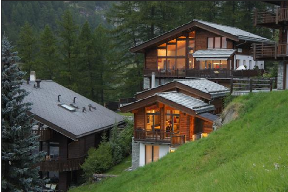
Chalet und Haupthaus