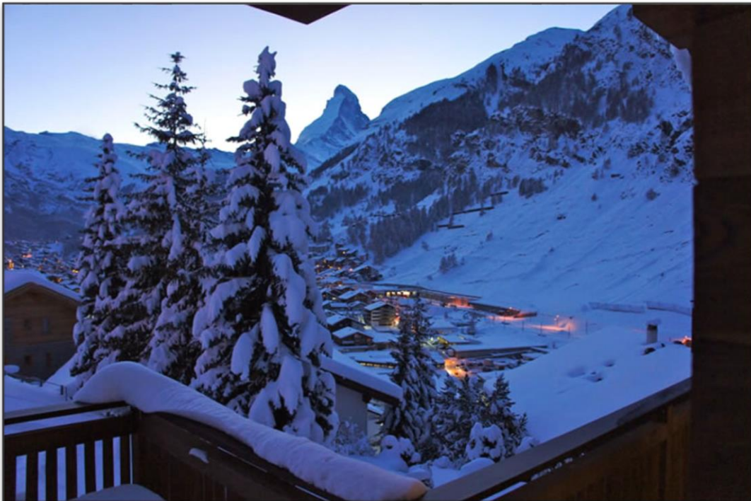
Aussicht Chalet A la Casa